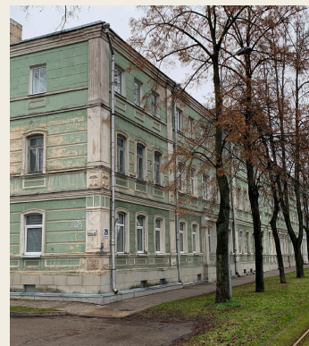
18. novembra iela 29