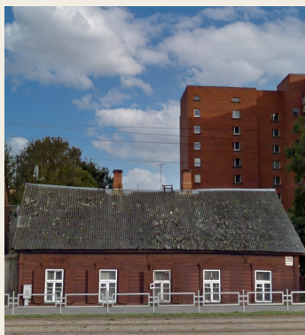
18. novembra iela 120

Pilsētas daļa, ko sauc par Jaunbūvi, bija ļoti populāra vācu iedzīvotāju vidū. Blakus atradās ne tikai Baznīcu kalns, bet arī dzelzceļa darbnīcas, kurās strādāja daudzi apkārtnē dzīvojošie vācieši. Tie bija inženieri, automašīnu apkopes speciālisti, sargi, tehniķi u.c. Varšavas ielu un tai piegulošās ielas pareizticīgo baznīcas pusē sauca par vācu apmetni. Atrastā informācija liecina, ka vācieši dzīvojuši Varšavas ielā mājās nr. 15, 21, 22, 43. No tām saglabājušās 2 mājas.