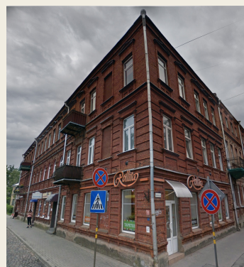
Lāčplēša iela 35