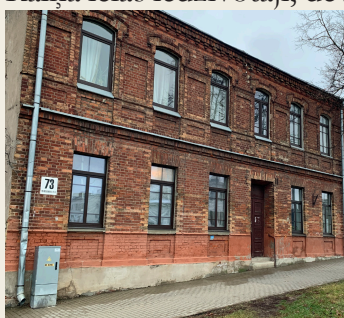
18. novembra iela 73

Pilsētas centrālā transporta artērija, 18. novembra iela (agrāk Šosejas iela), bija patiešām blīvi apdzīvota ar vācbaltiešiem. Zināms, ka vācieši dzīvoja mājās nr. 12 (10) , 19 (11) , 25 (12) , 29 (13) , 31 (14) , 56/59 (15) , 73 (16) , 120 (17) , kas izskaidrojams ar luterāņu baznīcas tuvumu, kuras draudzes locekļi viņi bija. 19. mājā (nav saglabājusies) dzīvoja barona Rūdolfa Štromberga ģimene, kurš dzimis Lašu muižā un miris Polijā netālu no Poznaņas 1945. gadā.