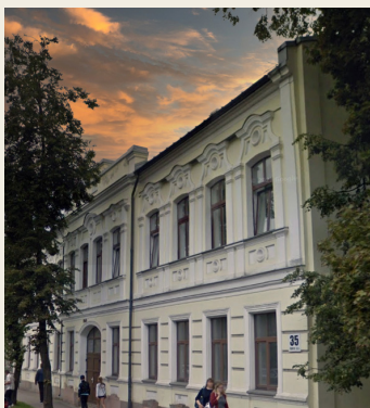
Imantas iela 35

Pirms Otrā pasaules kara Daugavpilī dzīvoja vairāk nekā 500 vācu tautības pārstāvju, kas bija nedaudz vairāk par vienu procentu no pilsētas iedzīvotāju kopskaita. Šai etniskajai kopienai bija savas pulcēšanās vietas.