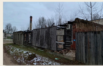
Ventspils iela 82