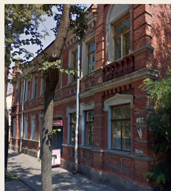
Cietokšņa iela 20

Pilsētas centrālā Rīgas iela vienmēr ir bijusi iepirkšanās vieta, šeit, Rīgas ielā 42, (4) iepretim baznīcai atradās brāļu Paulu tapešu veikals-noliktava. Brāļi dzīvoja citā vietā, kas tam laikam bija neparasti, tādējādi var uzskatīt, ka veikals bija pietiekami liels un, iespējams, aizņēma 2 stāvus.