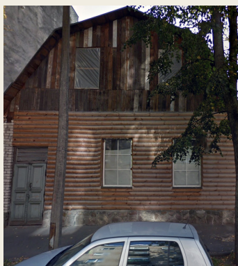
Cietokšņa iela 6

Pretī tam – 19. namā, kas vairs nepastāv, dzīvoja 4 cilvēku ģimene. Jauns vīrietis no šīs ģimenes piedalījās karadarbībā Vācijas pusē un gāja bojā Krievijā.