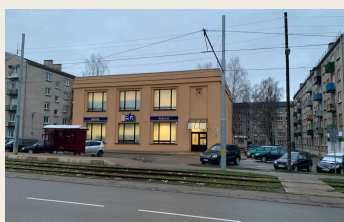
Ventspils iela 67/69