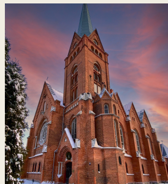
18. novembra iela 66

I r viedoklis, ka Daugavpilī pirms Otrā pasaules kara dzīvoja ļoti maz vāciešu. Ar šeit apkopto informāciju vēlamies pārliecināt mūsu pilsētas iedzīvotājus un viesus, ka, neraugoties uz to, ka vāciešu tiešām nebija daudz (apmēram 500 cilvēku), līdz 1939. gada rudenim viņu klātbūtne pilsētā bija diezgan jūtama. Lai arī kopš tā laika ir pagājuši gandrīz 100 gadi, mums izdevies atrast ziņas, kur vācieši dzīvoja, kāds bija viņu dzīvesveids, ar ko viņi nodarbojās. Šī informācija pagaidām ir samērā fragmentāra un apkopota no dažādiem avotiem. Ceram, ka iesākto darbu izdosies turpināt, pamazām veidojot arvien pilnīgāku ainu. Piedāvājam nelielu, neparastu ekskursiju pa Daugavpili, kurā mēģināsim izstāstīt un parādīt vāciešu neoficiālo dzīvi Daugavpilī pirms izbraukšanas no Latvijas.