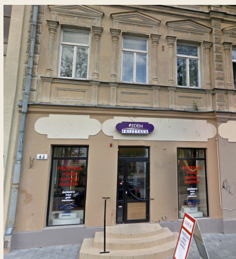
Rīgas iela 42