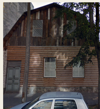
ул. Циетокшня, 6

На этой же улице в доме 6 (6) жили две немецкие семьи в количестве минимум 7 человек. Один из них был представителем склада пивных напитков и принимал посетителей прямо у себя в доме, как это было принято в то время. И в этой немецкой семье молодой человек погиб под Львовом. Дом обновлён, но стоит на старом фундаменте.