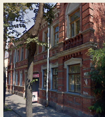
ул. Циетокшня, 20

Напротив него, в доме 19, который не сохранился, жила семья из 4 человек. Молодой человек из этой семьи участвовал в военных действиях на стороне Германии и погиб в России.