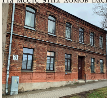
ул. 18 Ноября, 73

Центральная транспортная артерия города, улица 18 Ноября, ранее Шосеяс, была по-настоящему густо заселена балтийскими немцами. Известно, что немцы точно проживали в домах 12 (10) , 19 (11) , 25 (12) , 29 (13) , 31 (14) , 56/59 (15) , 73 (16) , 120 (17) , что можно объяснить близостью лютеранской церкви, прихожанами которой они являлись. В доме 19 (не сохранился) жила семья барона Рудольфа Штромберга, родившегося в имении Лассен и погибшего под польским городом Познань в 1945 году.