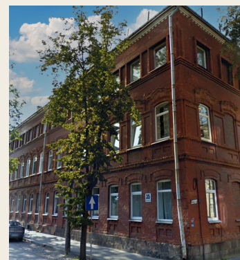
ул. К. Валдемара, 35

Немецкий родительский союз содержал немецкую частную школу (18-я начальная школа) в Даугавпилсе. Её адрес: улица К. Валдемара, 35 (3) . Дом был восстановлен. Деятельность школы поддерживала вся местная немецкая община, поэтому для школьных мероприятий были использованы просторные помещения