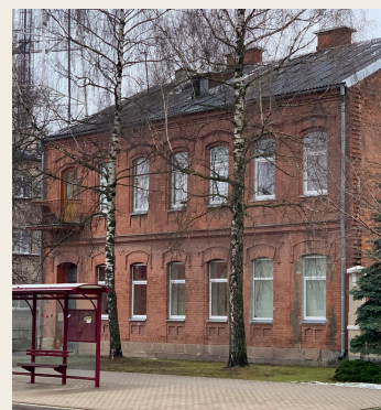
ул. Варшавас, 15

В доме 31, не сохранившемся до наших дней, проживали две сестры, которые одними из первых в нашем городе решились на переезд. Об этом свидетельствует объявление о продаже мебели, опубликованное в газете в октябре 1939 года.