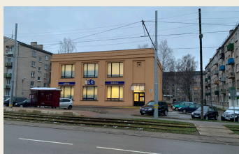
ул. Вентспилс, 67/69

Немцы жили и в других районах нашего города, например, на улицах Лиела Дарза, Виенибас, А. Пумпура и других, что подтверждает их факт присутствия в жизни Даугавпилса и позволяет понять их роль и значение в жизни города до осени 1939 года. Немцы активно занимались торговлей, индивидуальным и семейным