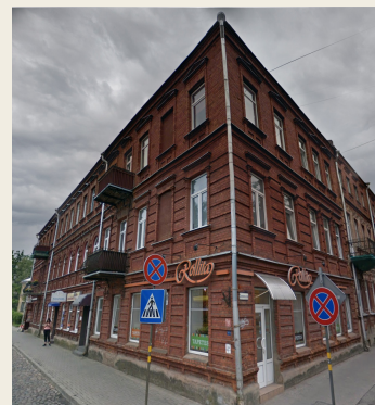
ул. Лачплеша, 35