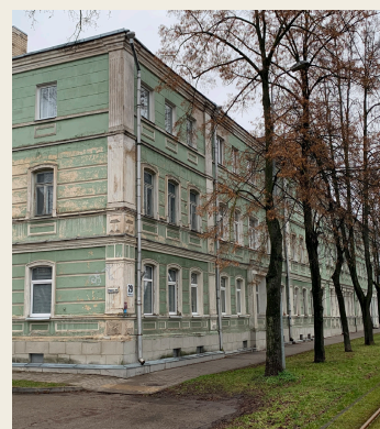
ул. 18 Ноября, 29