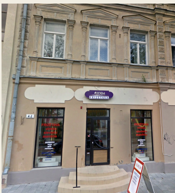
ул. Ригас, 42

городского клуба на улице Имантас, 31. Богатое традициями здание городского клуба было перестроено и сохранилось.