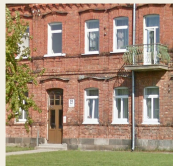
ул. Варшавас, 22

Улица Вентспилс, дом 82 (21) , деревянное заброшенное здание.