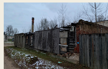
ул. Вентспилс, 82

Немцы жили и в других районах нашего города, например, на улицах Лиела Дарза, Виенибас, А. Пумпура и других, что подтверждает их факт присутствия в жизни Даугавпилса и позволяет понять их роль и значение в жизни города до осени 1939 года. Немцы активно занимались торговлей, индивидуальным и семейным