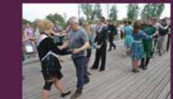
■ SENO DEJU MEISTARKLASES