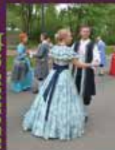
■ "VASARAS DĀRZS"