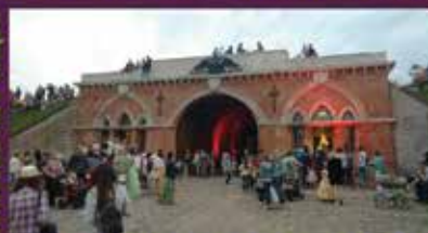
■ PĒTERA I UN KATRĪNAS I IERAŠANĀS