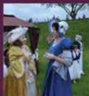
■ LAUKU LABUMI