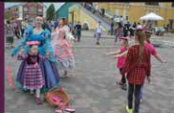
■ PRINCEŠU SKOLA