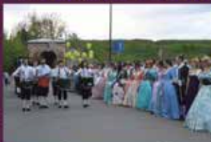
■ SVĒTKU PARĀDE