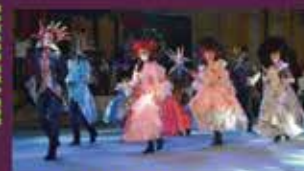
■ "LIELĀ BALLE"