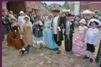
■ SENO TĒRPU KONKURSS