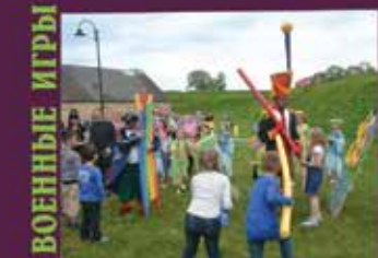
■ ZĒNU KARA SPĒLES