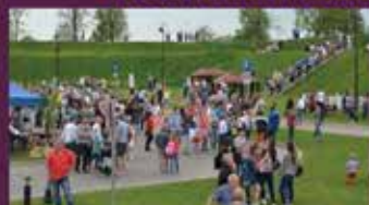
■ SENO AMATU DEMONSTREJUMI UN TIRDZIŅŠ