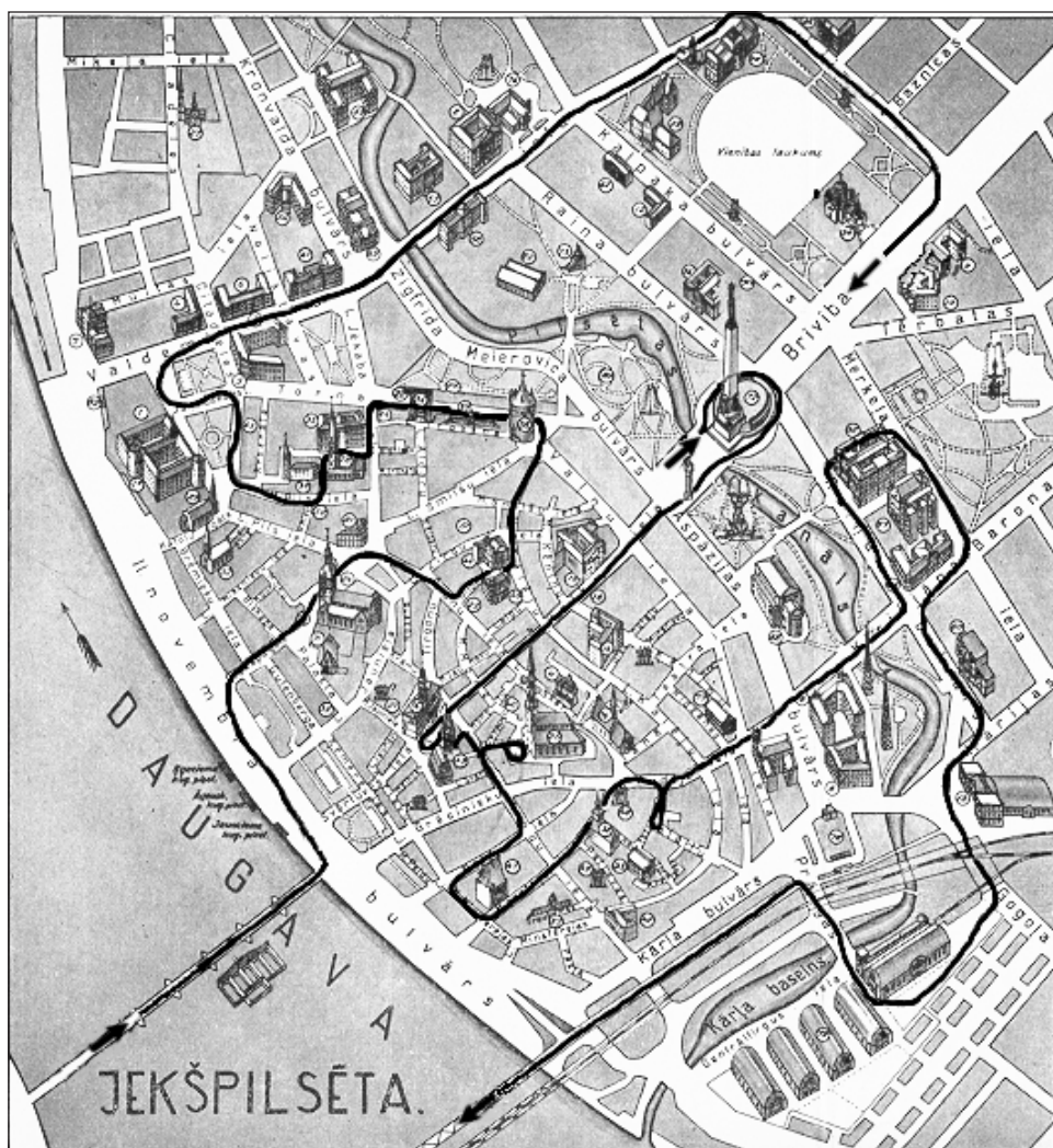
3. att. Rīgas pilsētas valdes tūrisma lietu pārziņa Viļa Zāģera 1937. gadā Rīgas pilsētas galvam apstiprināšanai iesniegtais Rīgas apskates maršruts.